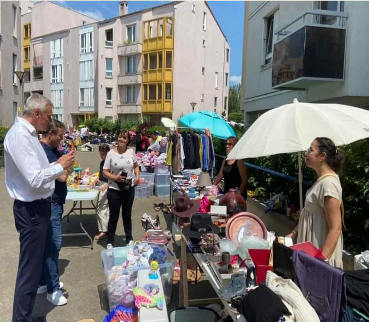
Stand du Conseil de Quartier