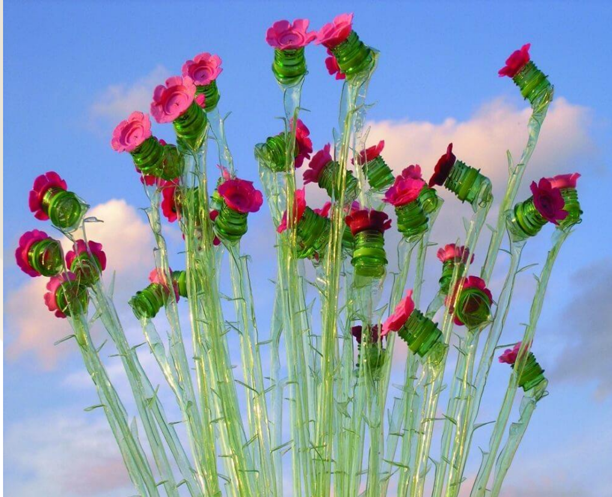
Sculpture réalisée à partir de bouteille en plastique