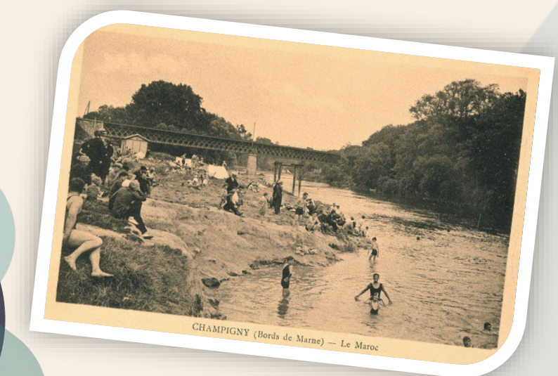
CHAMPIGNY (Bords de Marne) — Le Maroc